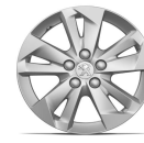
LLANTA DE ALU 16" TARANAKI