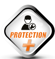
Ampliación de la garantía