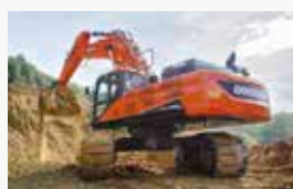
Excavadoras de orugas