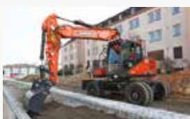
Excavadoras de ruedas