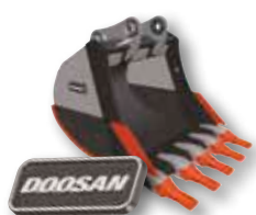
Implementos homologados por Doosan

Como especialista local, el distribuidor se asegurará de que obtenga la máxima rentabilidad de nuestro paquete integrado. Planifique con antelación para procurar el éxito de su equipo.