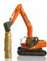
Soluciones de financiación