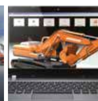
Sistemas de monitorización