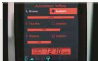
Implemento: ajustes seleccionables de caudal hidráulico auxiliar