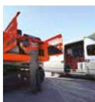
Contrato de mantenimiento