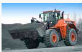
Cargadoras de ruedas