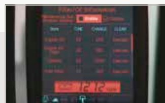
Mantenimiento: diagnósticos, estado del sistema e intervalos de servicio