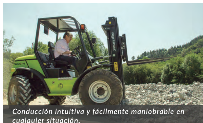
Conducción intuitiva y fácilmente maniobrable en cualquier situación.