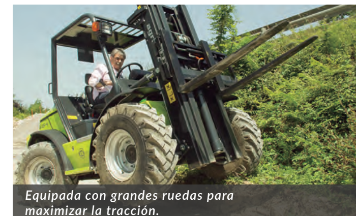
Equipada con grandes ruedas para maximizar la tracción.