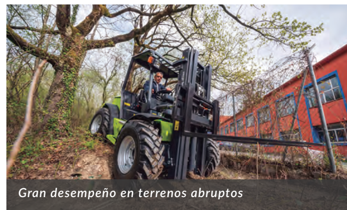
Gran desempeño en terrenos abruptos

Con todo, esta carretilla tiene varios aspectos técnicos en los que merece la pena detenerse. El primero de ellos es el motor mecánico Perkins de 50 CV Fase III A. Los ingenieros de Agrimac han priorizado el uso de un motor mecánico sobre uno electrónico para garantizar el mínimo coste de mantenimiento de la máquina. Los motores electrónicos son más caros de mantener y además requieren el uso de filtros de partículas