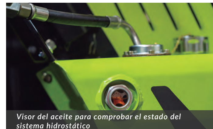
Visor del aceite para comprobar el estado del sistema hidrostático

La TW25 es un modelo formidable, cuidado hasta el menor detalle; pensado para un uso intensivo en las peores condiciones, configurado para un gasto mínimo en combustible y un gasto cero en mantenimiento.