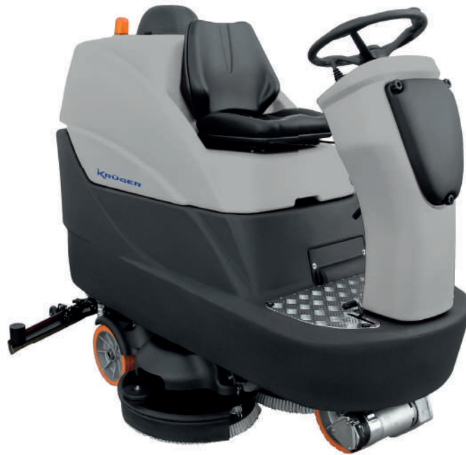
Cargador y baterías opcionales