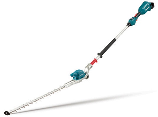
360° Imagen 360°

Muy ligero, solo 4,3 kg. Motor BL sin escobillas.