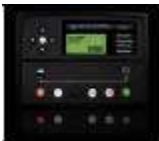
DSE 7310 – CENTRALITA DE CONTROL