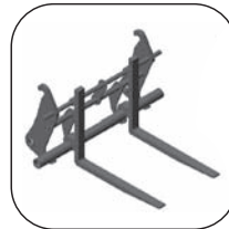
Horquillas para enganche rápido