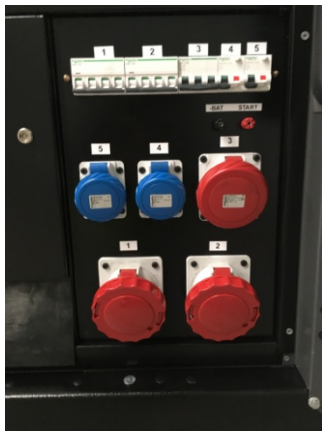
Tomas auxiliares IP 67: