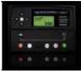
DSE 7310 – CENTRALITA DE CONTROL